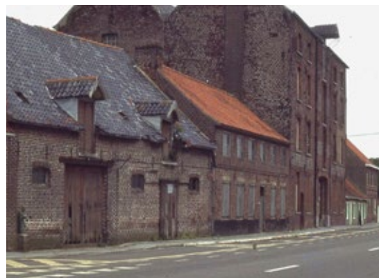
De wijk 't Hoeksken rond 1970, met de de hoppeast en oude woningen van voor de Eerste Wereldoorlog.