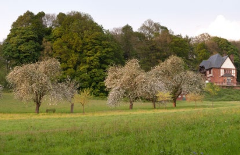
foto boven: Marguerite [6-7 jaar] met kinderbeid Barbe in het park