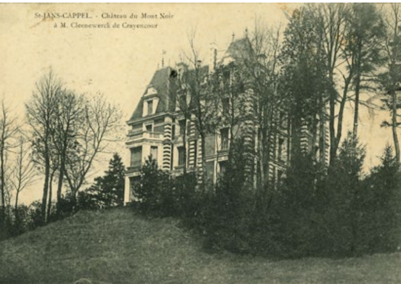
Het kasteel op de Zwarteberg

Het kasteel deed dienst als zomerverblijf. De Cleenewercks gingen overwinteren in een herenhuis in de rue Marais in Rijsel. Michel verkocht het kasteel in 1913 aan mensen uit Armentiers. Het kasteel werd vernield tijdens de bombardementen van de Slag om de Kemmelberg in het Lenteoffensief van april 1918.