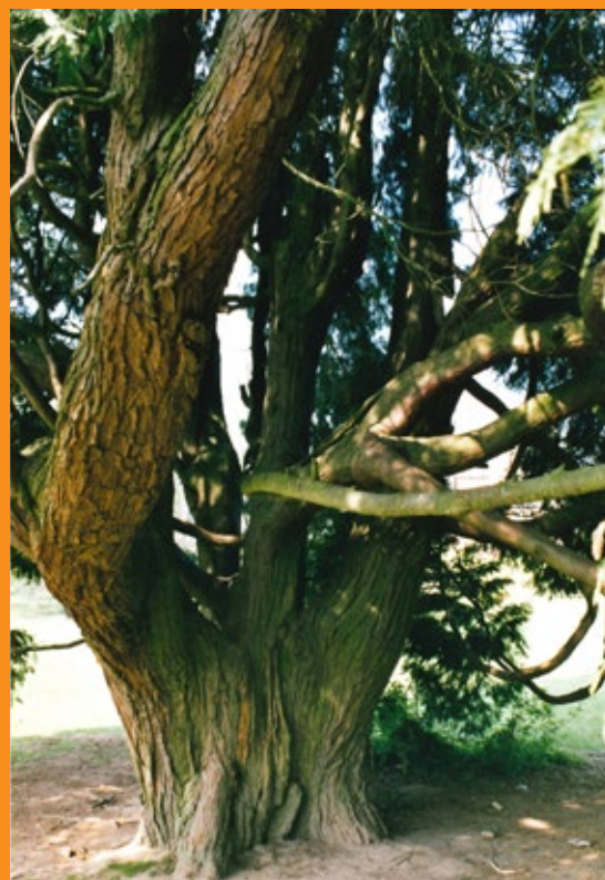
Californische cipres of Chamaecyparis lawsoniana